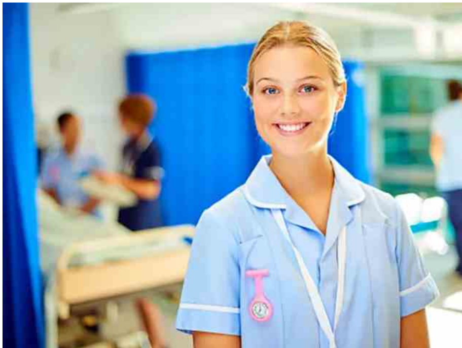
a young student nurse on a busy hospital ward smiles to camera . In the background one female student is with a nurse matron at a patient's bedside .