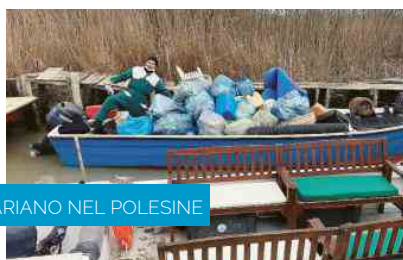
ARIANO NEL POLESINE

"Riportiamo in Italia i nostri infermieri emigrati, loro vogliono tornare, ma meritano condizioni adeguate"